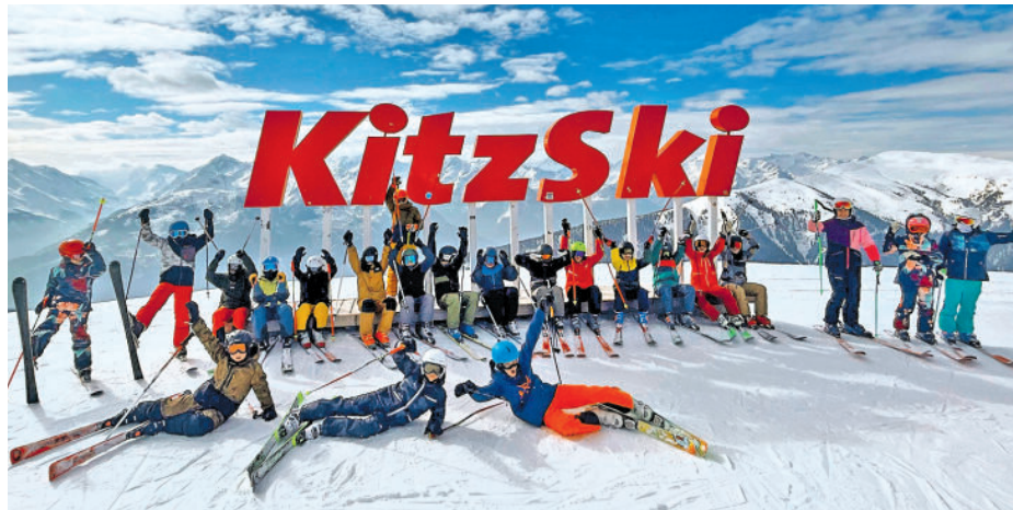
Eine Impression vom Wintersporttag (kl. Bild) und von den Ski-Schultagen.