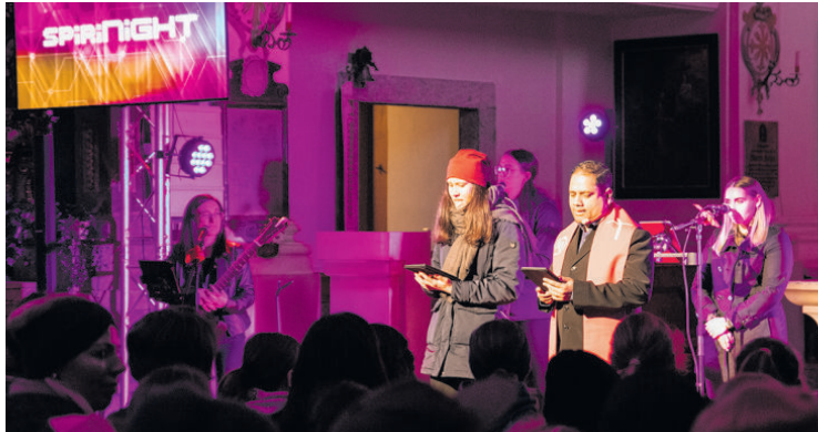
Ein Abend im Zeichen des Glaubens und der Gemeinschaft: Die „spiriNight“ 2023.

Den Auftakt des Abends stellte ein gemeinsames Eröffnungsgebet in der Pfarrkirche Mittersill dar, gefolgt von einer spannenden Workshop-Phase im Schulzentrum Mittersill. Zentraler Programmpunkt dabei war das sogenannte „Bibelhoagaschn“. Das ist eine besondere Methode des Bibel-Teilens, bei der die Jugendlichen gemeinsam mit Ehrenamtlichen ausgewählte Bibelstellen diskutieren konnten. Im Vordergrund stand dabei der individuel-