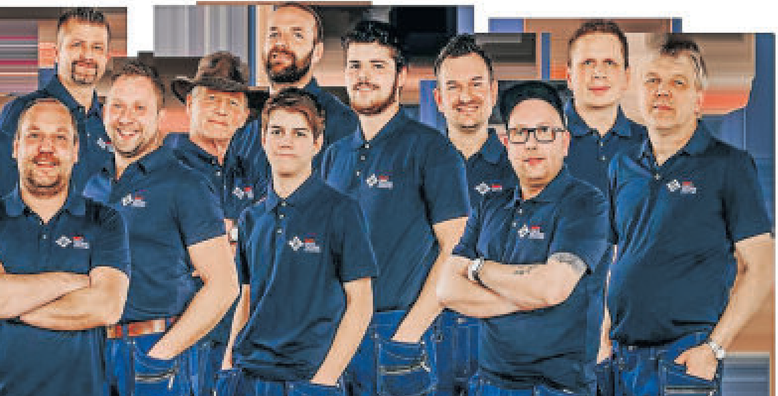
BILDER: TEAM HAUSTECHNIK GMBH &amp; CO. KG