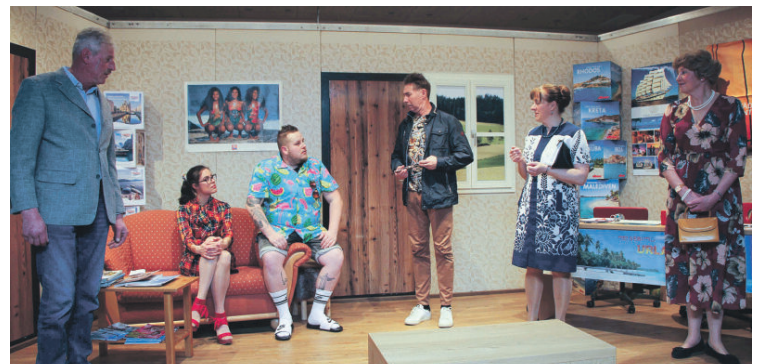
Ein Mann und seine zwei Frauen: Das war die verzwickte Situation im Theaterstück.

Die Theatergruppe Stuhlfelden mit neuem Stück.