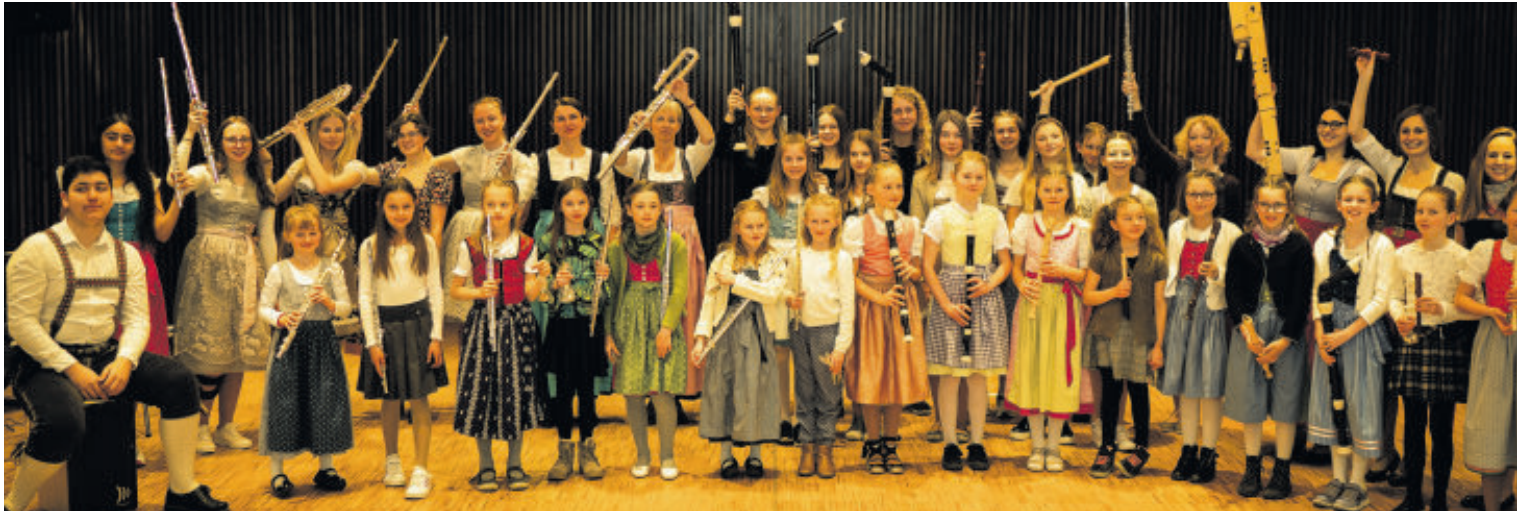
Im Bild: Die Schülerinnen und Schüler sowie die Lehrkräfte des Musikums Mittersill.