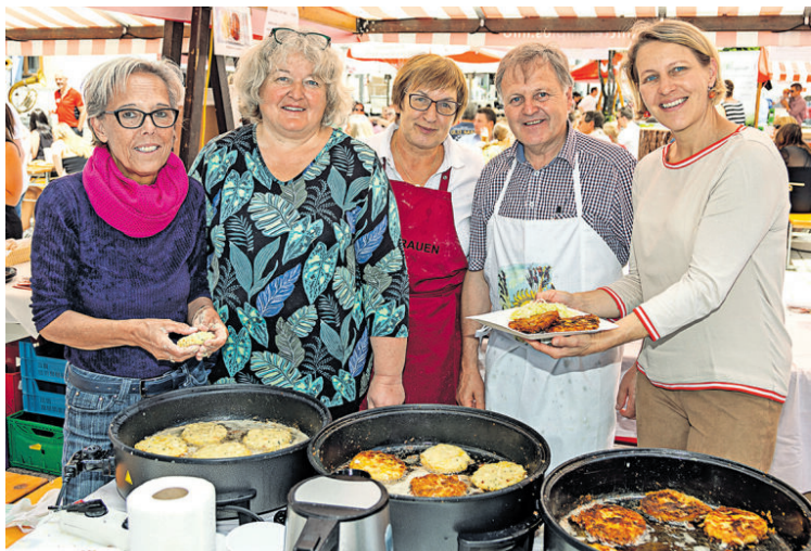
Mmmhhh – Pinzgauer Köstlichkeiten!