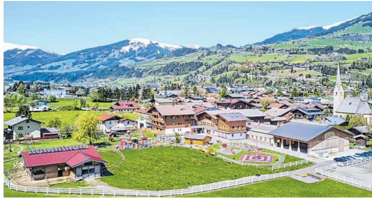
Ein herrlicher Platz für Familien mit Kindern in Felben.