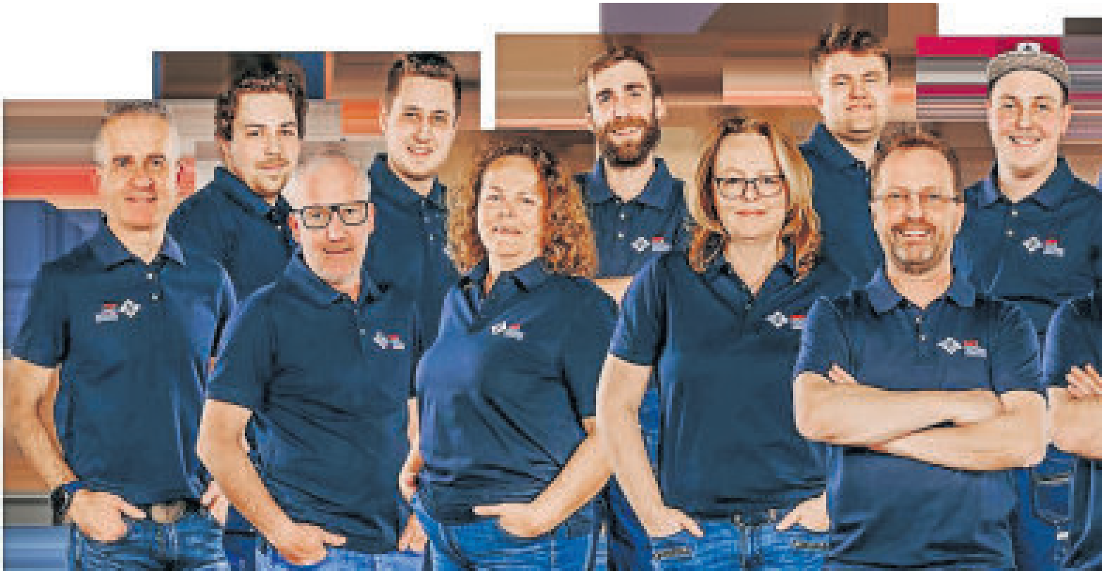
Die Mitarbeiterinnen und Mitarbeiter freuen sich nach der Fusion darüber, dass es gut weitergeht.