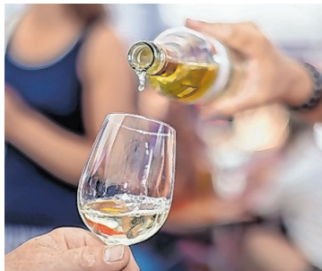
Ein edler Tropfen.

Los geht es mit kulinarischem Genuss. Um 11 Uhr beginnt das Fest „Wein trifft Pinzga Kost“. Der Herd daheim kann also kalt bleiben. Am Stadtplatz erwarten die Besucher Pinzgauer Köstlichkeiten und edle Tropfen von Winzern aus dem Weinviertel. Umrahmt wird das Fest mit einem