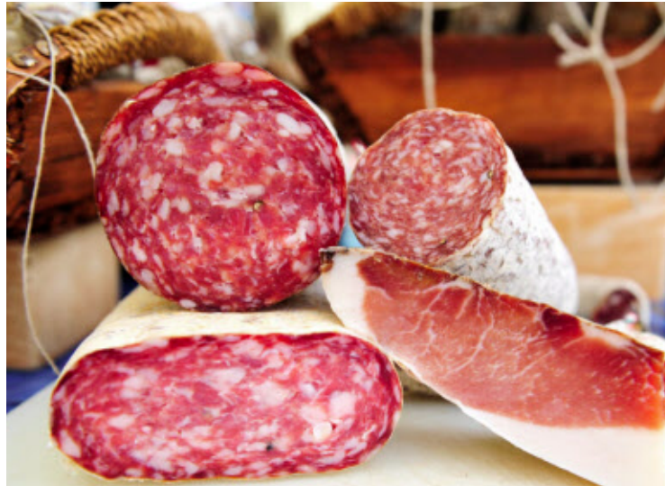
Am ersten Maiwochenende macht der „Mercato Italiano“ Halt in Mittersill. Ab Freitag, 12. Mai, beginnt die Wochenmarkt-Saison. An vier Freitagen wird direkt vor Ort frisch gekocht.

An vier Freitagen im Sommer wird am Mittersiller Wochenmarkt wieder frisch gekocht. Für