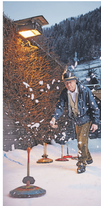
Eisstockschießen, ein geselliger Sport.

Beim Gasthof Schweizerhaus in Stuhlfelden kann man jeden