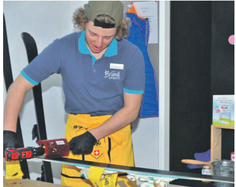
Ein Berufsschüler bei den PolySkills – er demonstriert die fachgerechte Präparierung von Skiern.

Der FB Handel und Büro schult die Jugendlichen in der richtigen Organisation. Die Arbeit am PC und kaufmännische Fächer sind Inhalt in diesem Fachbereich. Die Auslagengestaltung wird theoretisch erlernt und praktisch angewandt. Verkaufs- und Telefongespräche werden trainiert. In der Übungsfirma wird eine reale Firmenwelt simuliert (Bürokaufmann, Bankkaufmann, Einzelhandelskaufmann, Sportartikelverkäufer, Mediendesigner, Versicherungskaufmann).