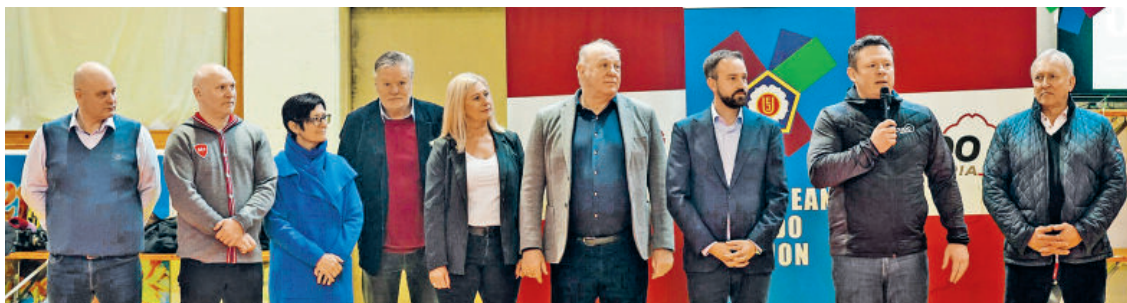
Auf der 1300 Quadratmeter großen Mattenfläche herrschte wieder Hochbetrieb.