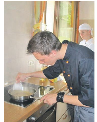
Ausbildung im Kochen in der schuleigenen Küche.

In dem FB Holz erlernt man die Tätigkeiten der Berufe Tischler und Zimmerer. Nach den Grundlagen der Fach- und Materialkunde plant und berechnet der Schüler sein eigenes Werkstück. Durch Erlernen und Verfeinern der Grundfertigkeiten wie Anreißen, Stemmen, Sägen oder Ho-