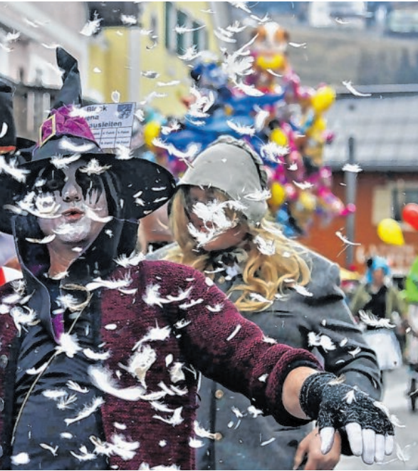
Impressionen vom Circus Halligalli 2019.