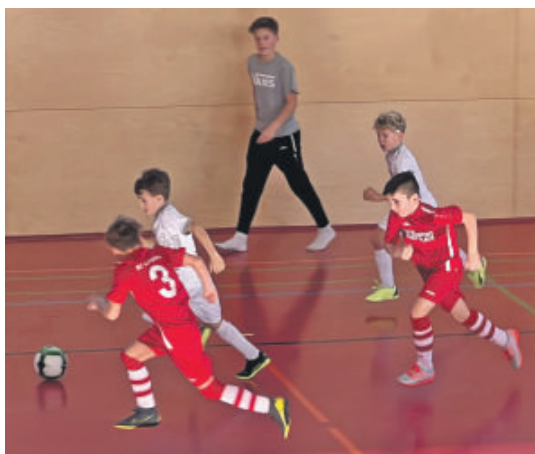
Eine Impression von der Partie Mittersill 1 gegen Mittersill 2, Altersklasse U10.

Mittersill. Beim Sportclub Mittersill (SCM) war die Freude darüber, am Jahresende wieder den Sparkassen-Hallencup ausrichten zu können, groß. Ganz besonders motiviert zeigten sich auch die jungen Kicker ab der U7. Die Bandbreite an Emotionen reichte von geballten Fäusten über Siegeszeichen hin zu Tränenflüssen wegen vergebener Chancen – ganz wie bei den großen Idolen. Das SCM-Team bedankt sich bei den Sponsoren und bei den freiwilligen Helfer/innen. Die siegreichen Fußballer/innen in den jeweiligen Altersklassen: Die TSU Bramberg (U7 und U8), der SC Mittersill (U10, U12, U14, U16) sowie der SC Leogang (Kampfmanschaften). noc