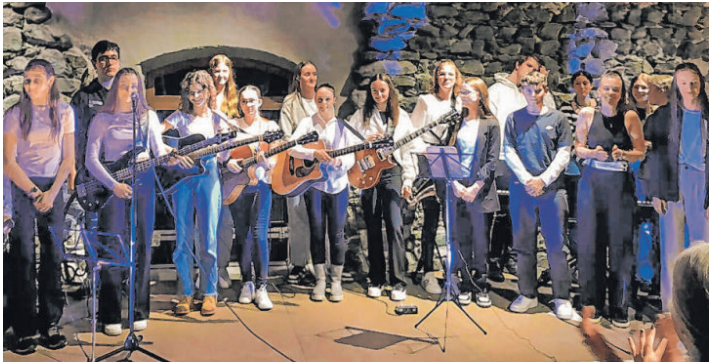
Ein Teil der BORG-Schülerinnen im Felberturm.