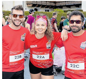
Das war 2023.

– Team Walking: 3er-Teams, jedes Team-Mitglied geht eine Strecke von fünf Kilometern. Keine Unterteilung in Geschlechter oder Jahrgänge, alle in einer Wertung.