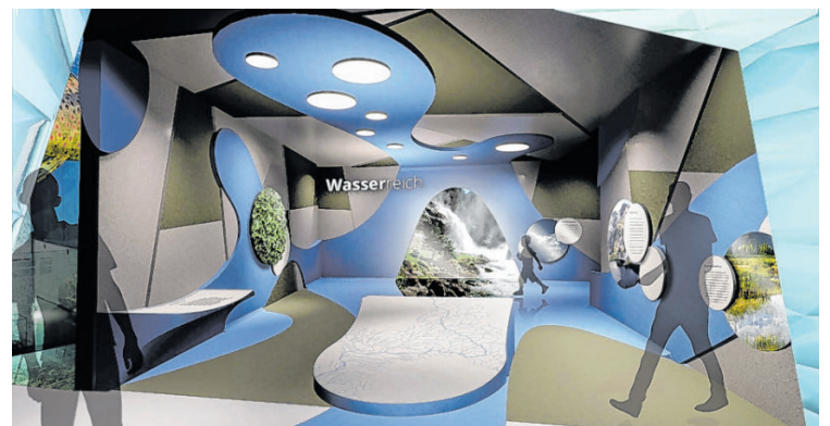
Visualisierung vom „Wasserreich“.

Zum Einsatz kamen bzw. kommen großteils Firmen aus der Region – wie etwa Knapp Bau, Wohnstudio Kogler, Hauschild Installationen oder die Elektrotechnikfirmen Bernhard und Aberger. Christa Nothdurfter