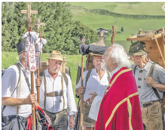
„Auf den Spuren der Samer“: Impressionen von bisherigen Wallfahrten.