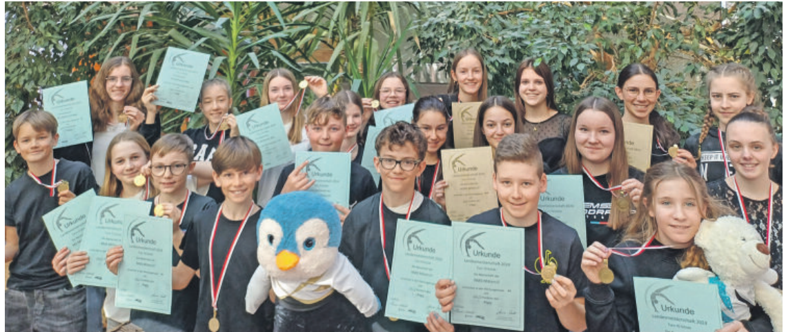
Die jungen Oberpinzgauer Turner/-innen zeigten sehr starke Leistungen.

Belohnt wurden die hervorragenden Leistungen mit drei Landesmeistertiteln (Mädchen MS Mittersill, Burschen MS Mittersill, Mixed-Team BORG Mittersill)