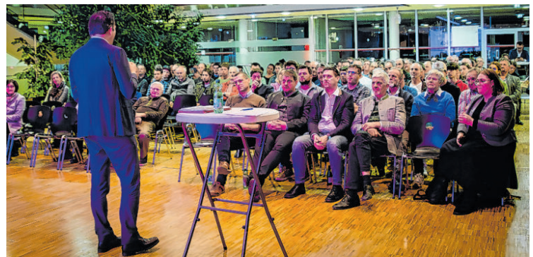
Rund 100 Interessierte kamen in die Halle für Alle.