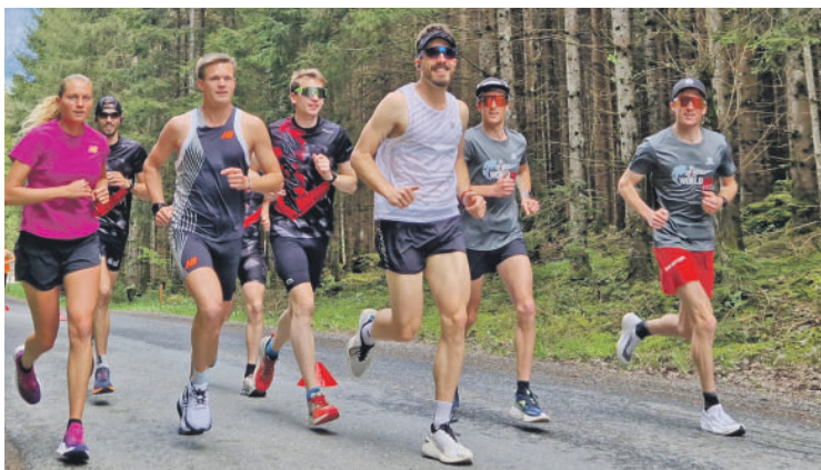
Wings for Life-App Run, Saalfelden 2023. Heuer steht auch in Mittersill ein organisierter Lauf am Programm.