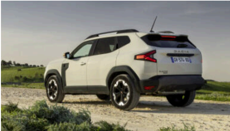
Der neue Dacia Duster.

Die Erfolgsgeschichte wird um ein Kapitel erweitert – in dritter Modellgeneration punktet der Duster durch eine perfekte Mischung aus alten Tugenden und einer Vielzahl an neuen Innovationen.