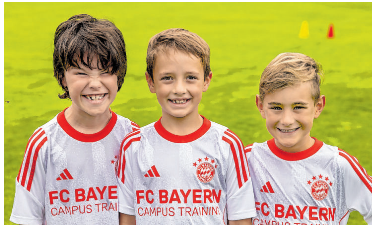
Insgesamt nehmen 100 junge Nachwuchskicker/-innen am Hollersbacher Campus-Training 2024 teil, hier drei davon.