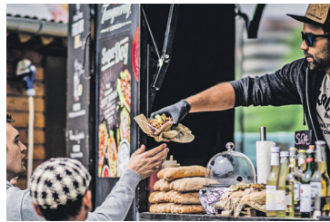
Gutes aus aller Welt

Mittersill. 23. bis 25. August: Street Food Market Austria, mit bisher über zwei Millionen Besucher/-innen auf den Food Events, und Mittersill Plus veranstalten gemeinsam „das Beste, was die Foodszene aus Europa momentan zu bieten hat. Das muss man gekostet haben!“ Freier Eintritt.