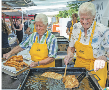
Köstliche Pinzgauer Schmankerl