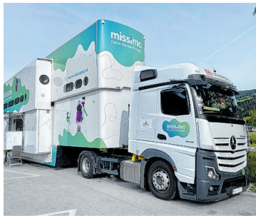
BILDER: VOLKSSCHULE MITTERSILL