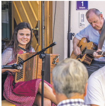
A nette Musi...