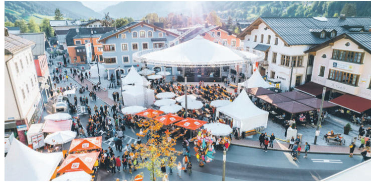
Eine Stadt im Festfieber – hoffentlich hält das Wetter.