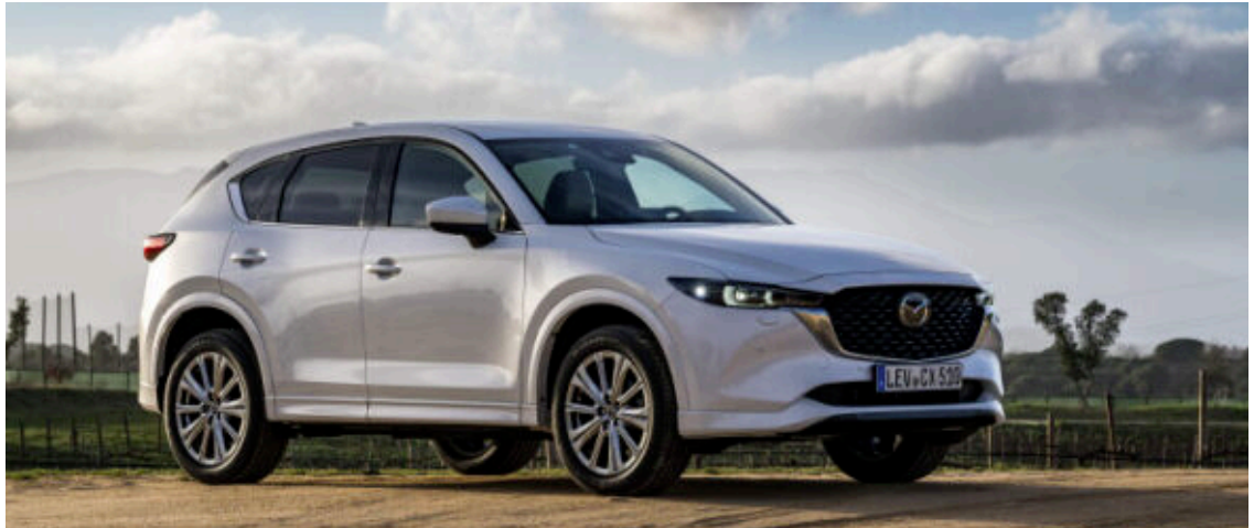
Den kraftvollen Familien-Crossover Mazda CX-5 gibt es ab einer Leasingrate von 149 Euro pro Monat.

Beim 165-PS-Benziner mit Schaltgetriebe liegt der kombinierte WLTP-Durchschnittsverbrauch bei 6,5 l/100 km, beim 194-PS-Automatik-Benziner ab 7,2 l/100 km. Ergänzt wird das Motorenangebot von einem 2,2-Liter Skyactiv-D Vierzylinder-Dieselmotor mit 150 PS oder 184 PS. Das Kodo-Design und die elegante Formensprache machen den Mazda CX-5 zu einem