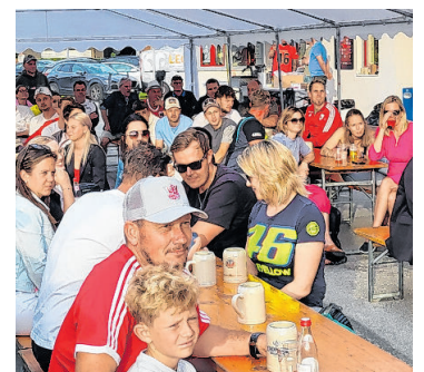
... und hier beim Public Viewing in Hollersbach.