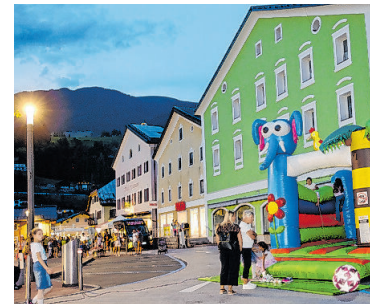
Shoppen bis 22 Uhr!