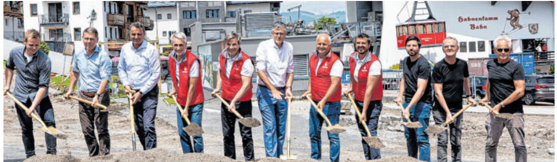
Führende Protagonisten beim Spatenstich für das Personal- und Bürohaus in Kitzbühel.