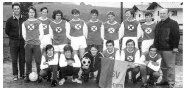
1972 konnten die Stuhlfeldener den ersten Meistertitel feiern.