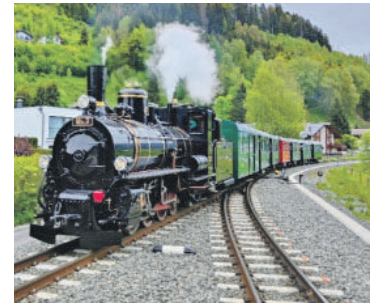
Mit Volldampf nach Mittersill! Gemütlicher kann man zum Shoppen nicht anreisen.

Reservierungen unter Tel. 06562/40600 oder unter pinzgauerlokalbahn@salzburg-ag.at