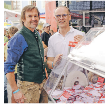
Bald geht's los!