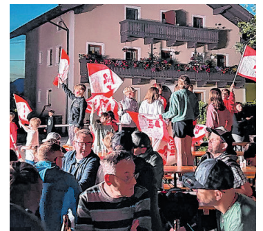
Gemeinsam macht's mehr Spaß, hier in Mittersill...