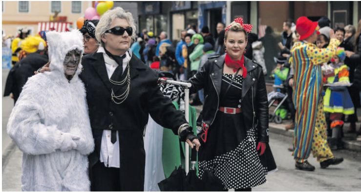
Faschingsumzug: Impressionen von 2023.