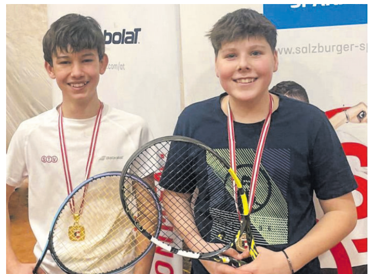
Große Freude herrscht bei den beiden Nachwuchstalenten nach ihrem großen Erfolg bei den Landesmeisterschaften.

Zell am See) bei den Jugendlandesmeisterschaften im Tennis (indoor) am 1. und 2. Februar überzeugen und sich dank einer starken Performance sowie eines kühlen Kopfs im Finale schließlich gegen alle Konkurrenten durchsetzen und sich damit den Landesmeistertitel sichern.